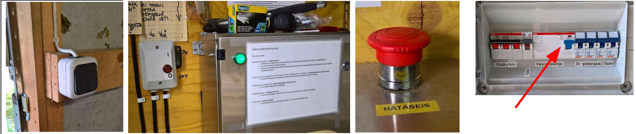
Kuva 1 Vanhan ampumakopin valokatkaisija kytkee sähköt myös vanhaan valvokoppiin.